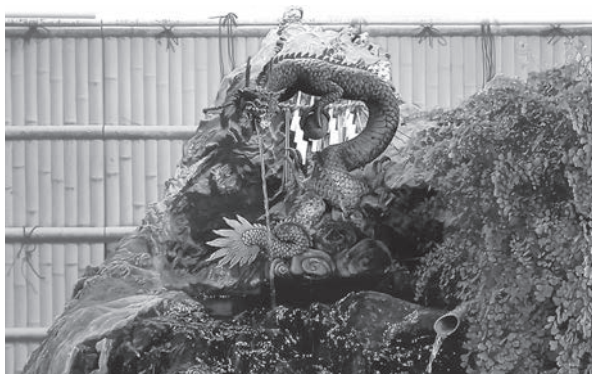
〈馬橋稻荷神社〉手水舎