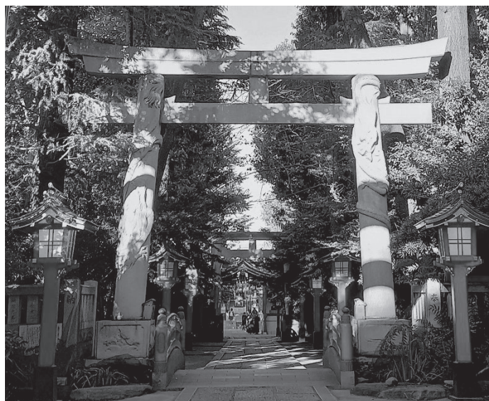
〈馬橋稻荷神社〉昇龍・降龍が刻されている