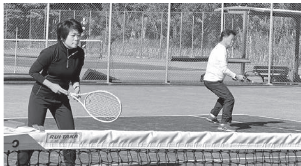
支部対抗テニス大会