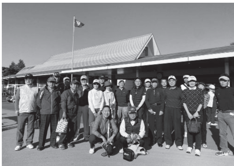
12月7日 第4回支部ゴルフコンペ