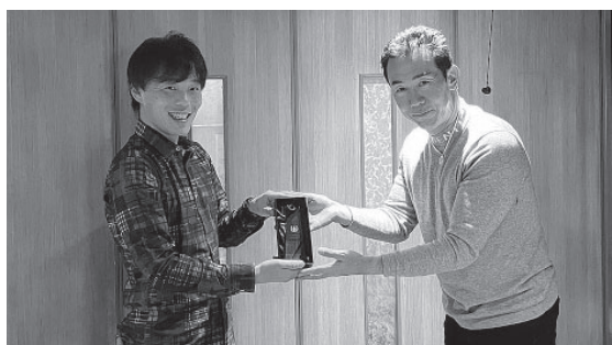
ゴルフ 年間 MVP