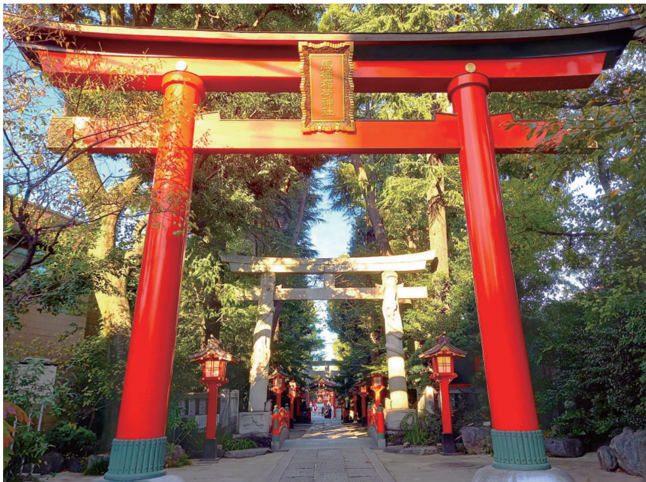
撮影場所：馬橋稻荷神社