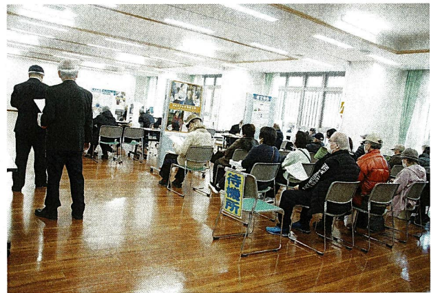
実叡コミュニティホール