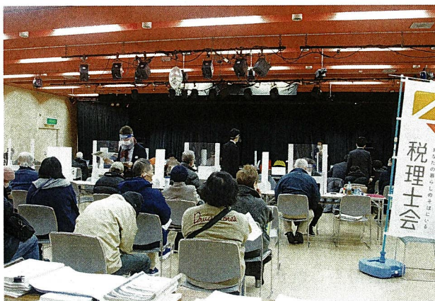
八千代台文化センター