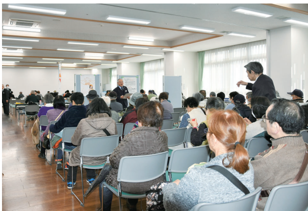
実朮コミュニティホール