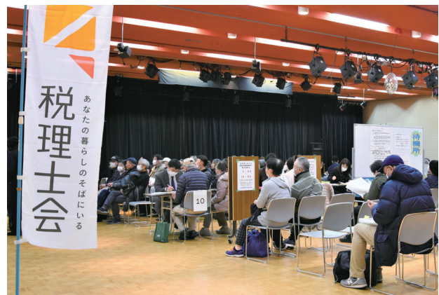
八千代台文化センター