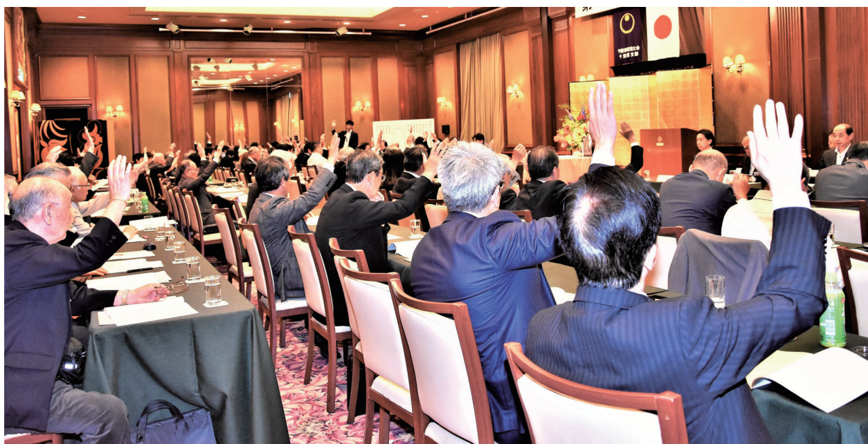
賛成！ 議案承認可決！