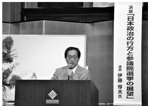
政治アナリスト 伊藤惇夫氏