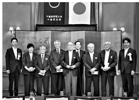
受賞者の皆様 おめでとうございます