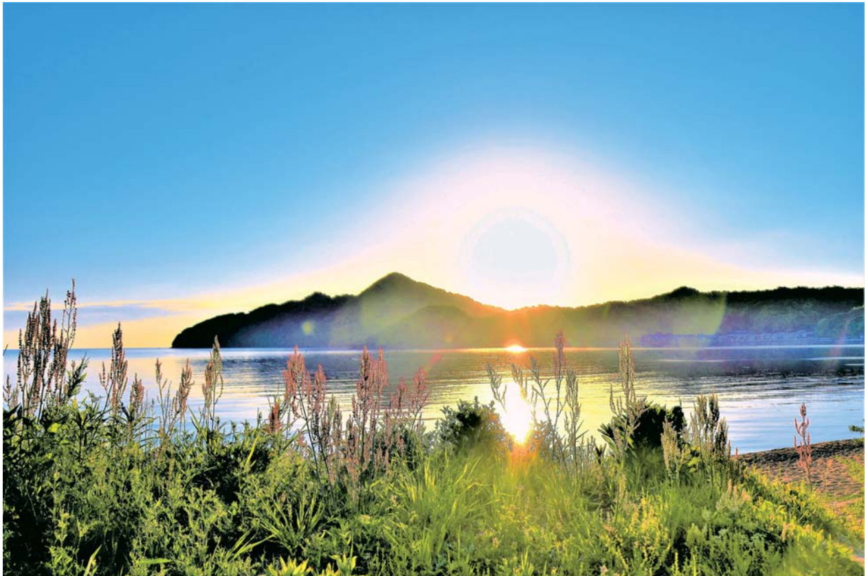
京 都 府 宮 津 市 宇 田 井 田 井 海 水 浴 場