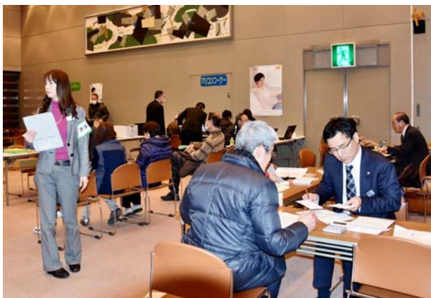
勝田台文化センター