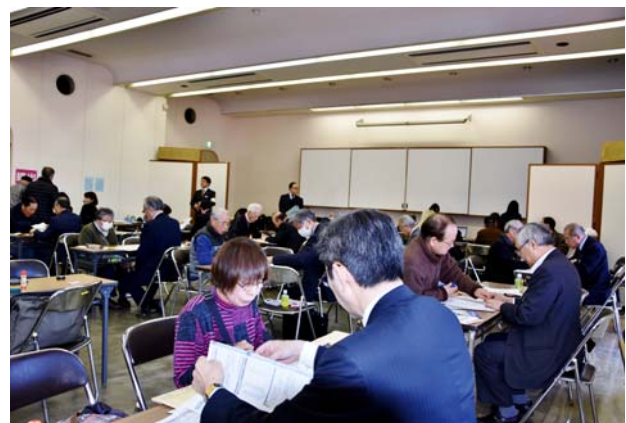
習志野市消防庁舎